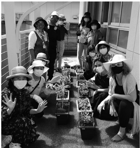
6月30日 「つながり」第1回 交流会

ユニバーサル・カフェ「つながり」は、今、話題性もある「エディブルフラワー（食べられる花）」などの栽培を通じて、コミュニケーションを促進し、出身国という「見えない壁」を取り払い、多様な人たちが集まり、自己実現を目指すための第一歩となる場として誕生しました。第2回を8月7日に第3回を9月28日に、それぞれ開催しました。