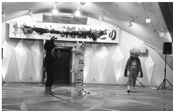
2019年開催 平和のタペより