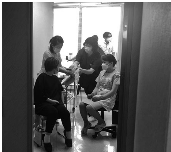
9月3日 徳島検診クリニックで1回目の職域接種

その後、政府によるワクチン供給が滞り、およそ1ヶ月半遅れでの実施となりましたが、接種が確定した会員の皆様には、9月2日・4日・5日で1回目、9月30日、10月2日、3日に2回目の接種を無事受けていただきました。