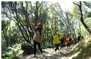
ノリノリの参加者（同僚と一緒に）

ゆったりとした休日の時間が流れる中で、家族や友達、職場の人たちと一緒に、自然に親しみながら、あちこちで見られた笑顔、楽しそうなおしゃべり。