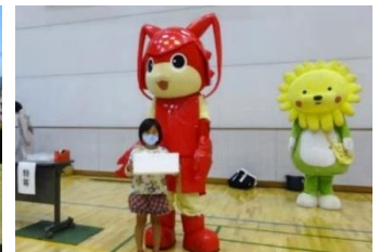
大盛り上がりの抽選会