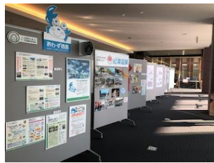
公益財団法人徳島県勤労者福祉 ネットワークパネル展