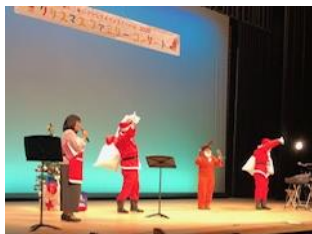
サンタさんからのプレゼント