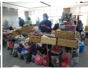
クリエイターズマーケット