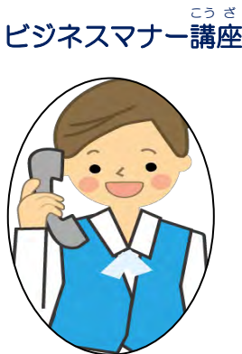
ビジネスマナー講座