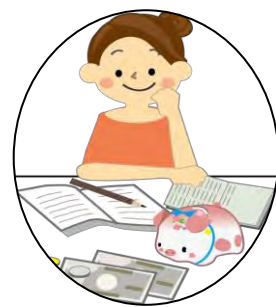
ライフプラン講座