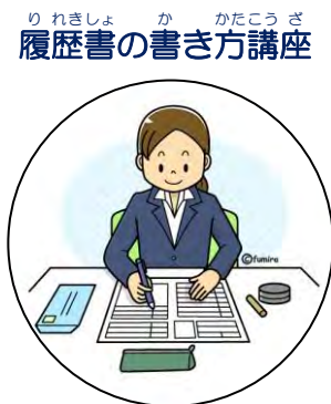
履歴書の書き方講座