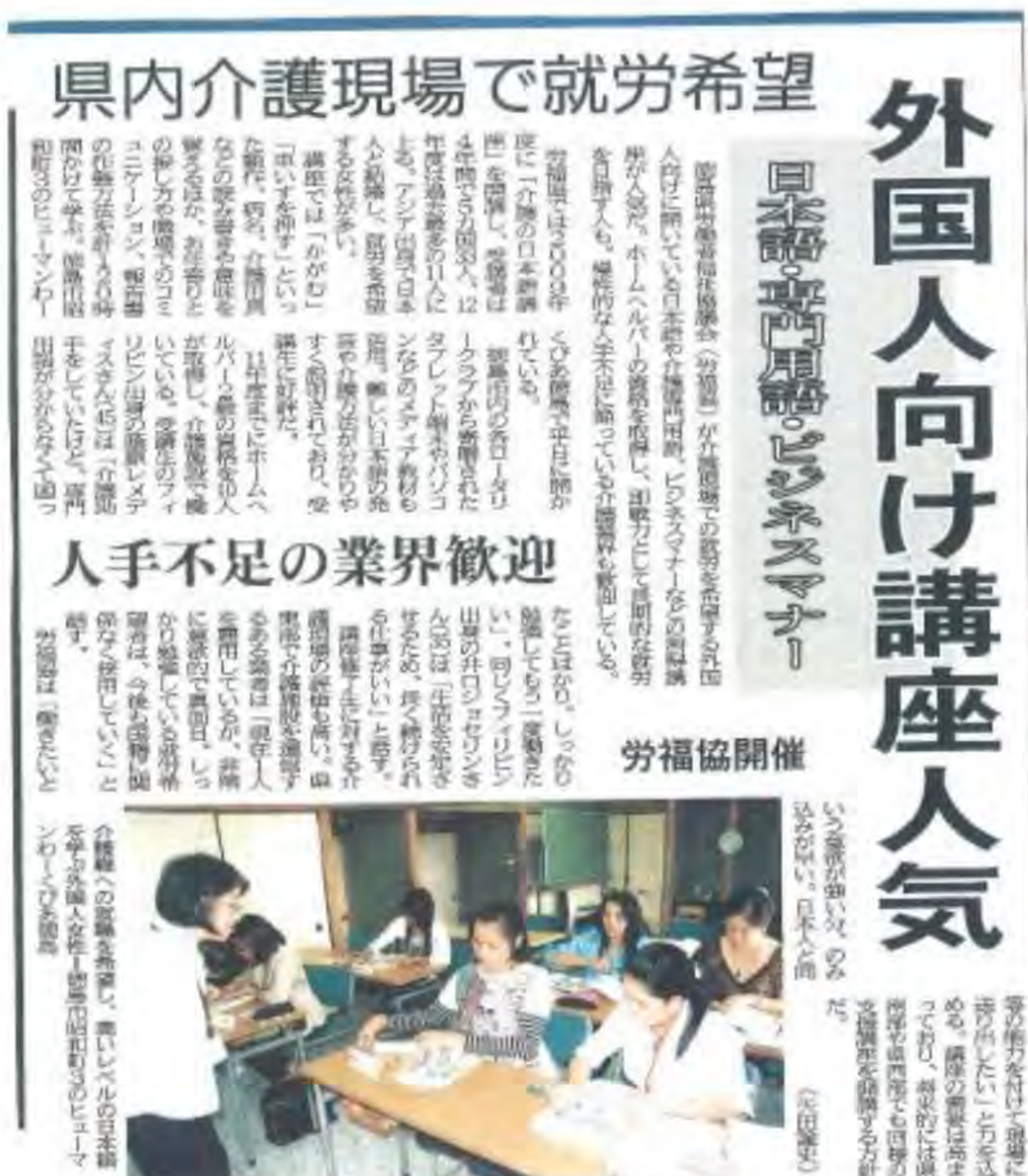
9/13, 20, 25 徳島新聞取材 10/10 朝刊掲載