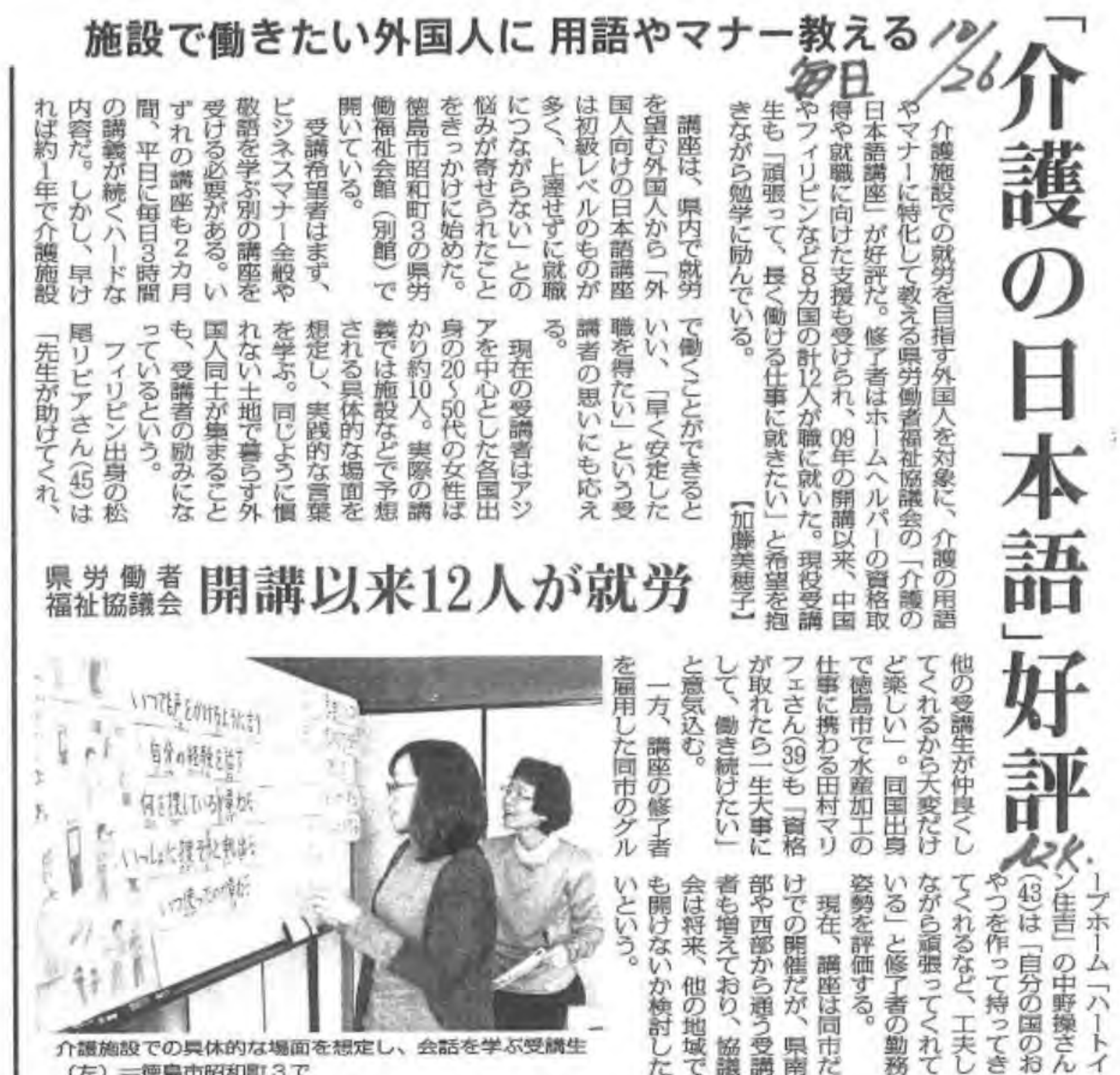
10/17 毎日新聞取材 10/26 朝刊掲載